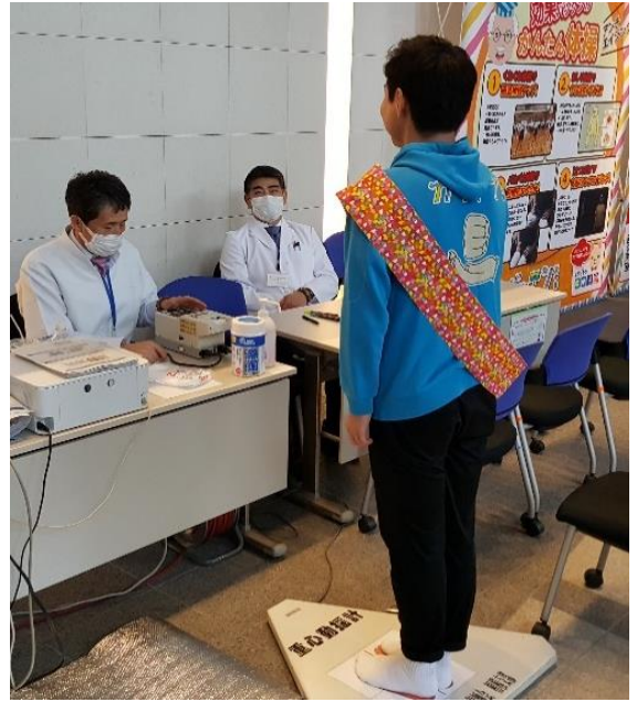
写真4 重心動揺計 測定実施状況