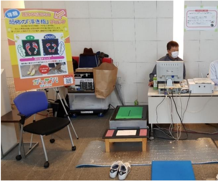
写真3 足底分圧測定 実施状況