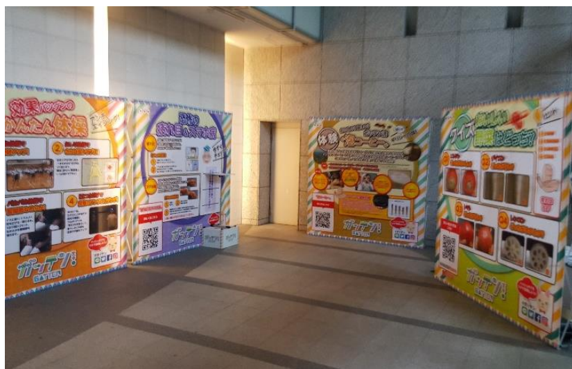
写真2 1階エントランス展示②