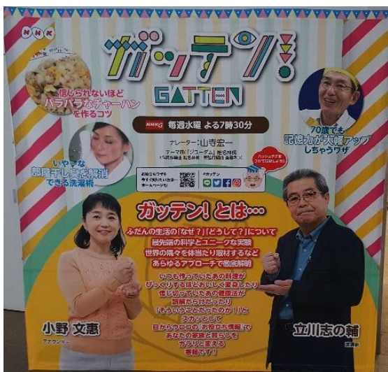
写真1 1階エントランス展示①