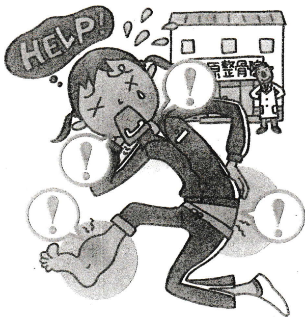
イラスト・佐藤博美

このようなけがに対応するのが柔道整復師だ。手技や包帯などによる固定といった方法があり、総称して「柔道整復術」と呼ばれる。聞き慣れない人もいる