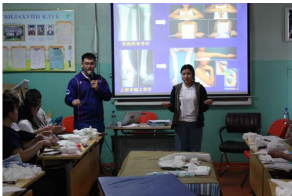
写真5 上腕骨顆上骨折理論