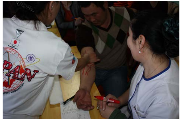
写真4 上腕骨顆上骨折理論