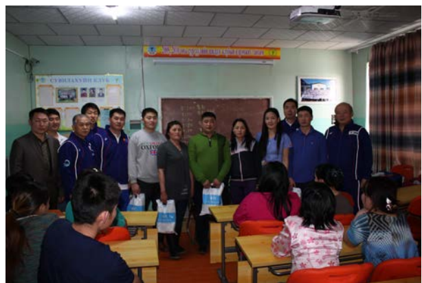
写真10 成績優秀者一同

JICA 草の根技術協力事業（パートナー型）日本伝統治療（柔道整復術）指導者育成・普及プロジェクトとして、ゴビアルタイ県の准医師 24 名、大医師 1 名を中心に、ゴビアルタイ県（25 名）・オブス県（1 名）・バヤンウルギー県（7 名）、計 33 名で講習会を実施した（写真）。ホブド県の多くの准医師は、講習会開催日直前に家畜の疫病発生のため、県外に出ることができないというアクシデントに見舞われたが、無事終了することができた。