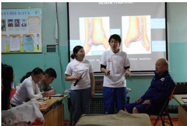
写真7 下腿骨果部骨折理論