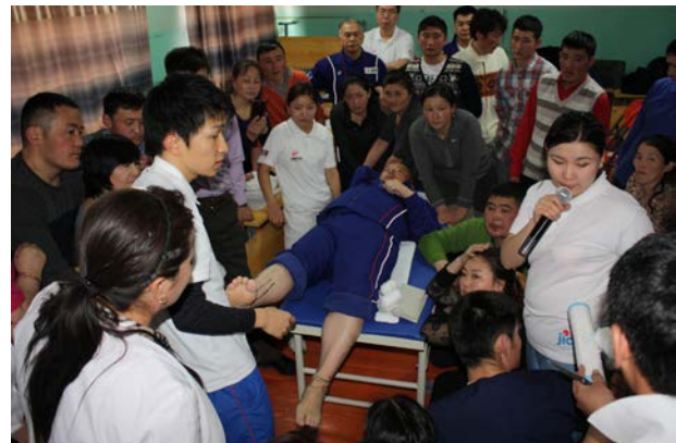
写真8 下腿骨果部骨折実技